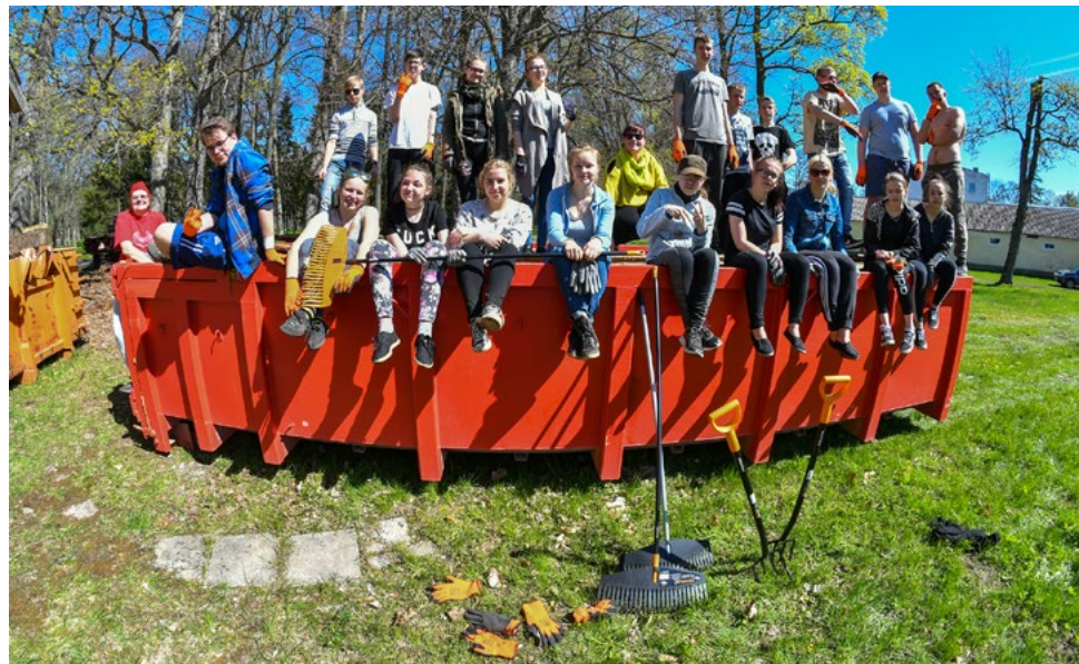
Pärandivaderite talgud Tõstamaa Keskkoolis. mais 2018