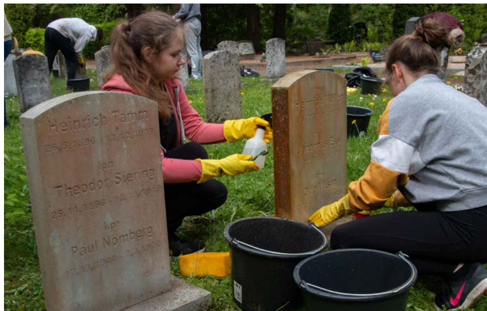
Rakvere linnakalmistu talgetel osalenud abiturientidel oli korrastatud hauaplatsiga isiklik side, kuna mitmed viimses rahupaigas puhkajad olid Vabadussõjas langenud oma kooli õpilased, otse koolipingist lahingusse läinud 18- ja 19-aastased noored. Foto: Elle Lepik, 1. juunil 2022

ja töövahendite transportimiseks koolibussi kasutamise võimalust. Ehk on võimalik kooli toitlustuse korraldajaga kokku leppida talgumenüü, et söögi saaks objektile kaasa võtta ning kulud katta