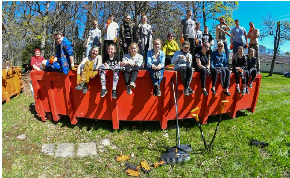
Pärandivaderite talgud Tõstamaa Keskkoolis. mais 2018