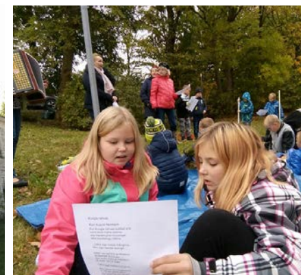
Mõisaselfide konkurss ja Karl August Hermanniga laulude võistulaulmine Esku-Kamari koolis.