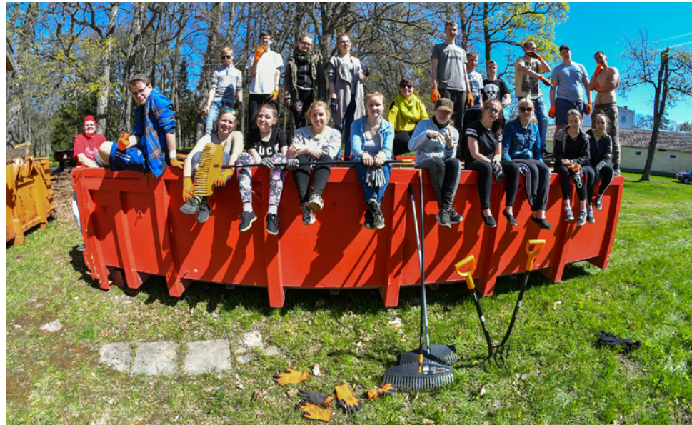
Pärandivaderite talgud Tõstamaa Keskkoolis. Foto Toomas Mitt, mais 2018

Maakondlikud muinsuskaitseinspektorid on kõige pädevamad aitamaks Sul leida objekte, mida korraldada. Inspektorite soovistega saad tutvuda meie kodulehel ja nende kontaktid leiad Muinsuskaitseameti veebilehelt . Kutsu talgutele kaasa lapsevanemaid ja vabatahtlike kohalikust muuseumist, koduloo-uurimisseltsist vm kogukonnaliikmeid, kes aitaksid vajadusel raskemate tööloikudega ning hoolitseksid ka selle eest, et planeeritud tööd ei jääks lõpetamata.