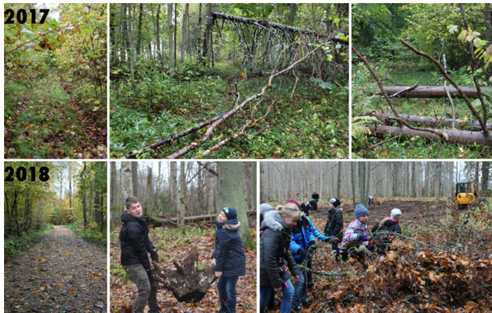
Heimtali Põhikool von Siversite kalmistul. oktoobris 2017 ja oktoobris-novembris 2018

Talgupäeva planeerides mõtle läbi, kus asub lähim WC ja kus/kuidas saab käsi pesta.