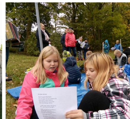
Mõisaselfide konkurss ja Karl August Hermanniga laulude võistulaulmine Esku-Kamari koolis. mais ja oktoobris 2018